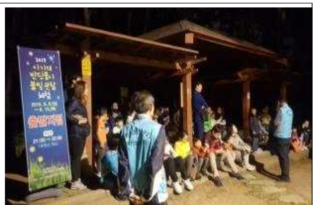
2019년 체험행사 사진