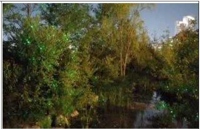
반딧불이 레이저 조명