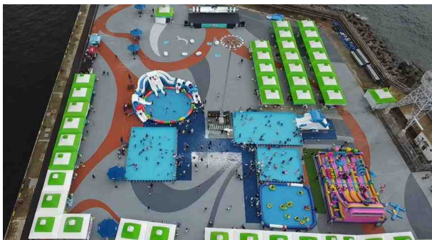
2023년 남구 물놀이 축제 전경