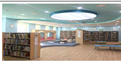
영유아 자료실 (1층)