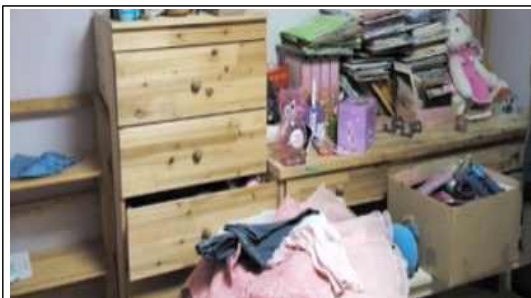
아이방 꾸미기 전