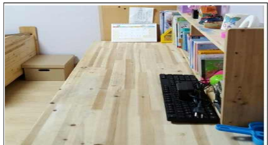
아이방 꾸미기 후