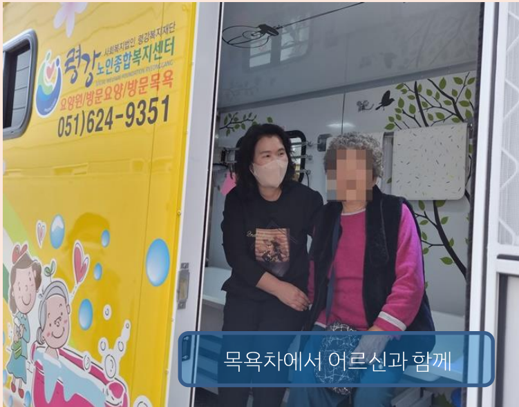
목욕차에서 어르신과 함께

대연1동은 영강노인종합복지센터의 목욕차 지원으로 3월 이동목욕서비스를 개시했다.