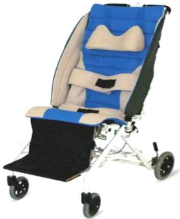
자세유지기능형 휠체어 (전신마비 환자용)