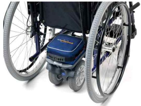
보호자용 수동휠체어 전동팩 (언덕, 오르막 등 사용)