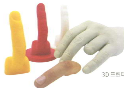
3D 프린터 활용 손가락 의지