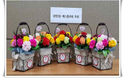
에스플라워 꽃바구니 후원