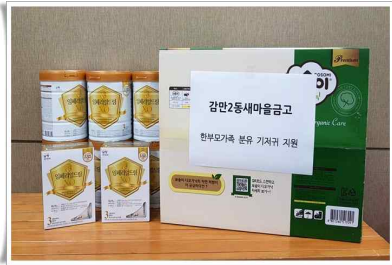
감만2동새마을금고 한부모가족 후원