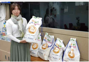
광역푸드뱅크 생필품 후원