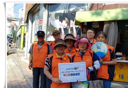
복지사각지대 발굴 캠페인 (2018.7.25.) 남광시장 일대 홍보활동