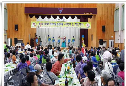
이웃사랑실천모임 경로잔치 (2018.6.21.) 76세이상 어르신 400분 초대