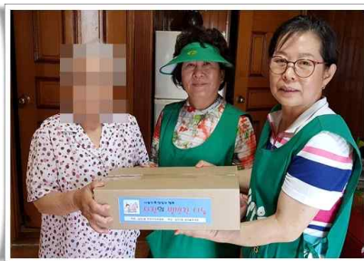
주민자치 공동체 형성 사업 실시 사랑의 밀반찬 나누기 (200세대)