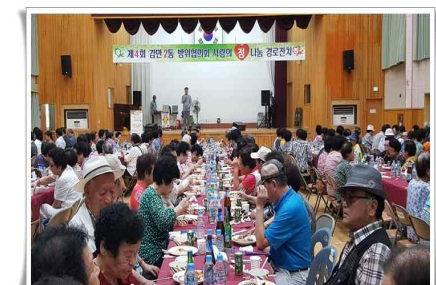
방위협의회 제4회 사랑의 정나눔 경로잔치 (2018.8.19.) 독거노인 200분 초대