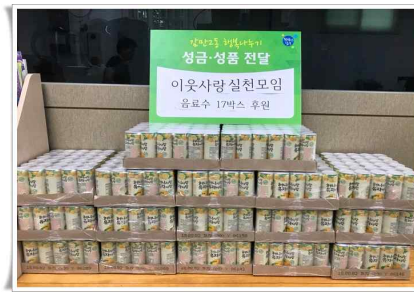
이웃사랑실천모임 음료수 17박스 지원