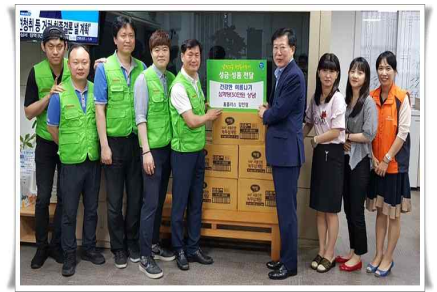
홈플러스 감만점 삼계탕팩 50만원 상당 지원