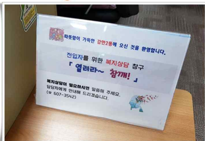
전입자를 위한 복지상담 실시