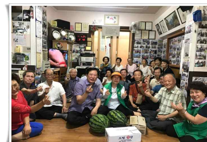
새마을부녀회 시원한 여름나기 경로당 방문 (2018.7.27.)