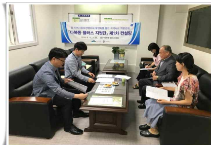
지역사회보장협의체 컨설팅 (2018.6.29.) 협의체 운영 개선방안 등 컨설팅