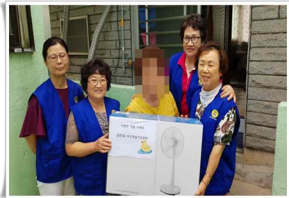
바르게살기위원회 선풍기 50개 지원