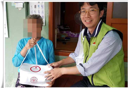
한국아쿠르트 구급상자 10개 지원