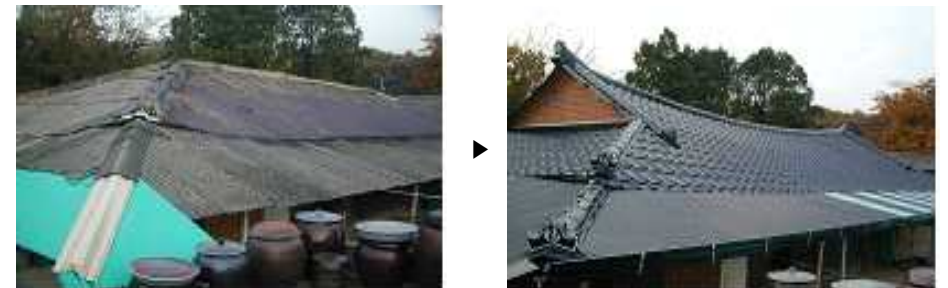
☎ 사업안내 : 시 기후대기과(☎888-3576), 구(군) 환경위생 부서