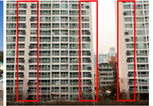
공동주택 예시 (수영구 협성애플파이아파트)