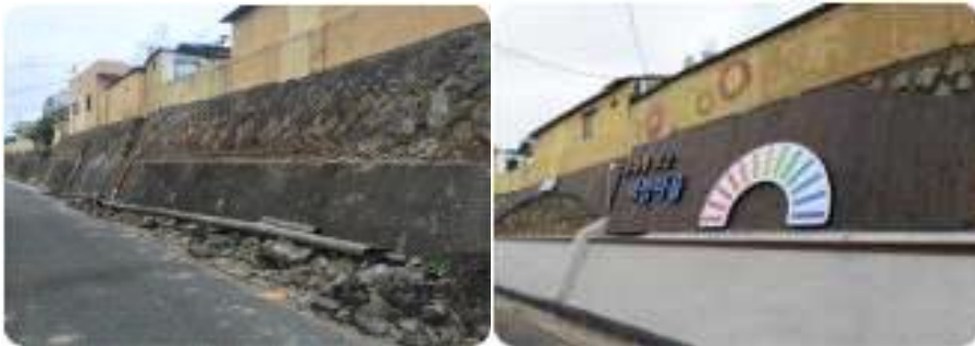
☎ 사업안내 : 시 도시경관과(☎888-4335)