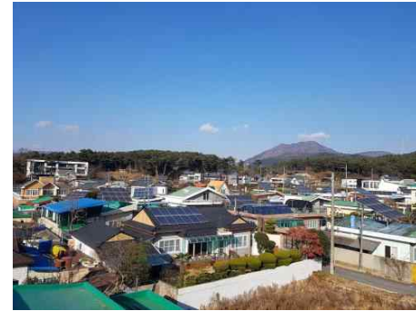
단독주택 예시 (금정구 신천마을)