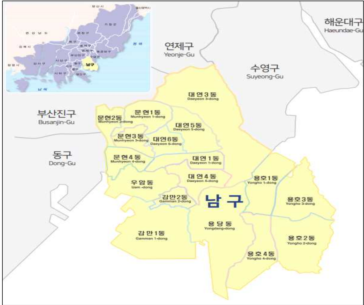
<그림 1> 남구 행정구역도