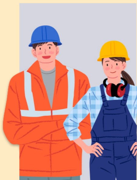
① 공사장 야외근로자