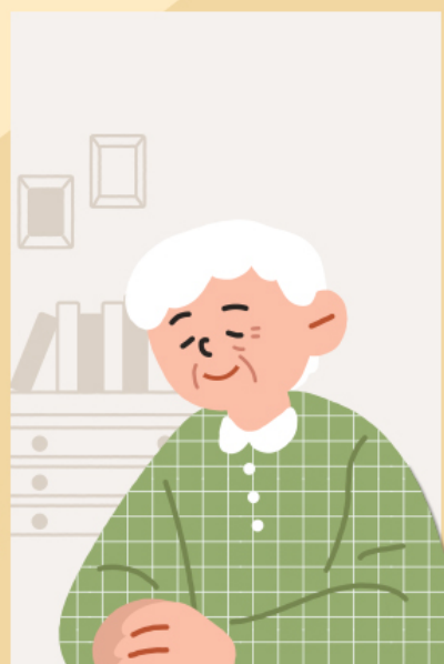
③ 독거노인 등 취약계층