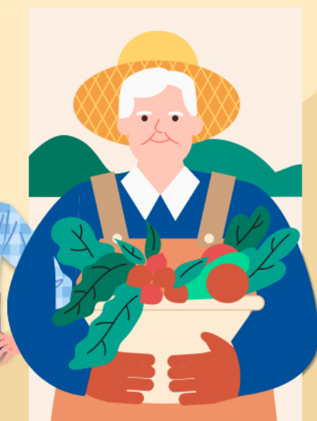
② 고령층 논·밭 작업자