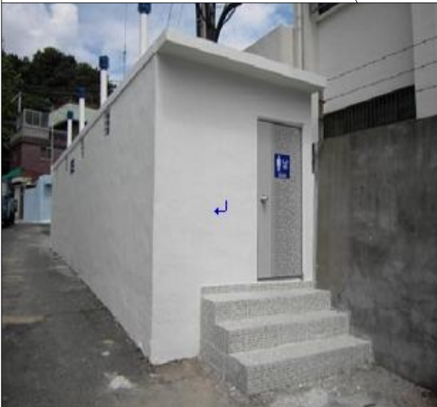
우암1동 219-10 (화장실 외부)