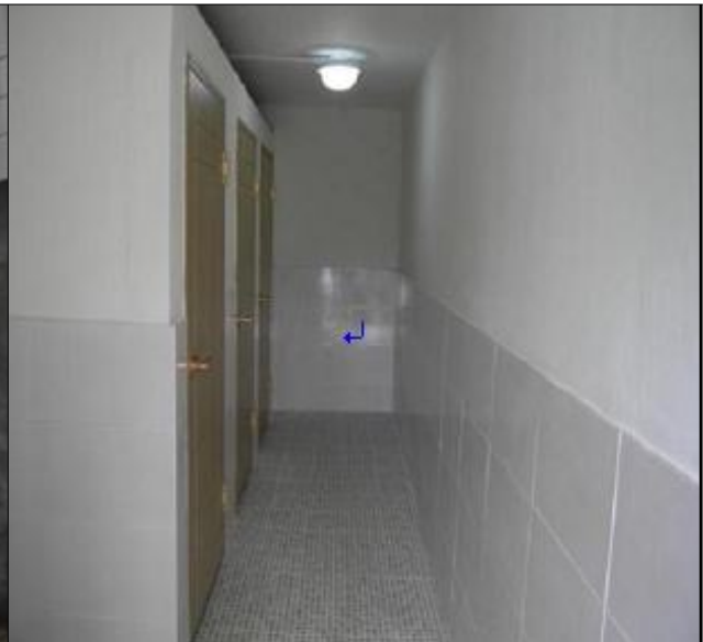
우암1동 219-10 (화장실 내부)