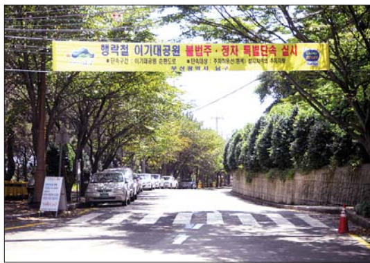
이기대공원 순환도로 주차허용선을 따라 차량들이 주차해 있다.

남구는 최근 이기대공원 순환도로에 주차허용선(흰색)을 긋고 주차질서 확립에 나섰다.