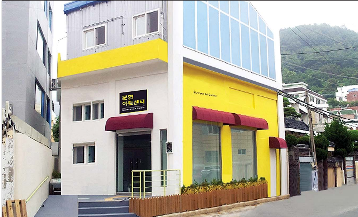
수돗물을 고지대로 끌어올리기 위해 설치됐던 문현3동 폐가압장이 지역주민들을 위한 문화예술공간으로 탈바꿈한다.