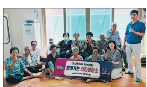
○...대연6동은 매주 수요일 '찾아가는 건강상담소'를 운영하며 경로당을 방문해 혈압·혈당 측정 등 건강 상담과 함께 어르신 건강관리 및 냉방기 점검 등 폭염 대비 안전 점검도 병행하고 있다.