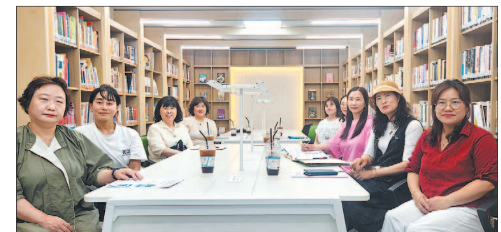
대연4동 자원봉사캠프 회원들

습제는 마스크, 밴드, 캔들 방향제 등과 함께 꾸러미에 담겨 홀로 어르신들께 전달되었다. 단순한 봉사를 넘어, 청소년들이 다양한 형태의 봉사활동을 체험하고 지역사회에 기여할 수 있도록 돕는 이 프로그램은 대연4동 캠프의 대표적인 청소년 참여 사례로 손꼽힌다. 캠프는 또 재개발구역 내 노후 주택 밀집지역에서 발생하는 쓰레기 문제를 해결하기 위해 고자 '쓰담 활동(환경정화)'을 월 1회 이상 진행하며 깨끗한 마을 환경의 중요성을 알리고 있다.