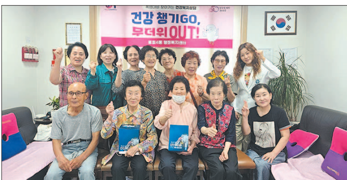
용호4동 용호4동은 경로당 8곳을 찾아가 폭염 대비 건강수칙 안내, 맞춤형 건강상담을 제공하는 '찾아가는 건강복지상담소'를 운영했다.