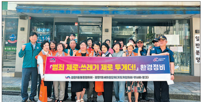
감만1동 안전소통위원회는 지난 7월 11일 민·관 합동 방범 순찰활동인 ‘범취 제조 투게더!’ 사업을 실시했다.