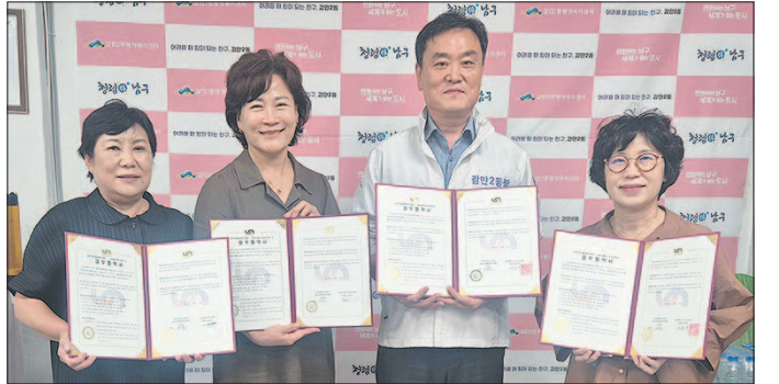
감만2동 감만2동은 지난 7월 17일 노인돌봄기관과 복지사각지대 발굴과 지원체계 구축을 위한 업무협약을 체결했다.