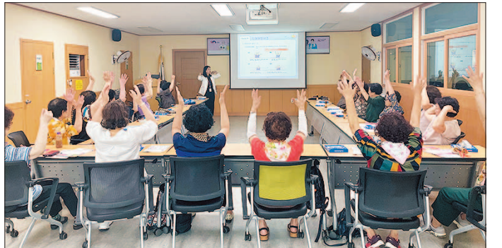
문헌1동 문헌1동과 건강지원센터는 지난 7월 8일 60세 이상 주민을 대상으로 건강정보를 제공하는 ‘우리동네 건강교실’을 개최했다.