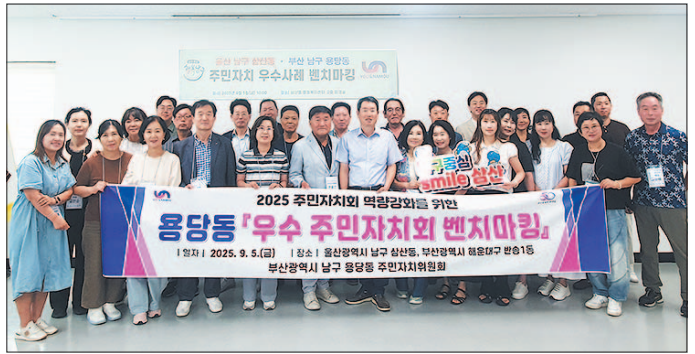
용당동 주민자치위원회는 지난 9월 5일 울산 남구 삼산동과 부산 해운대구 반송 1동 주민자치회를 방문해 우수 주민자치회 벤치마킹을 실시했다.