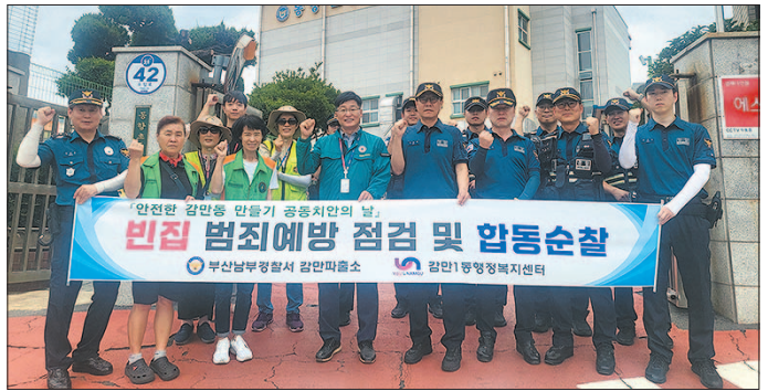
감만1동 행정복지센터는 부산경찰청 기동순찰대, 감만파출소, 지역자율방재단 등과 합동으로 민·관·경 합동 유괴 예방 및 범죄예방 캠페인을 전개했다.