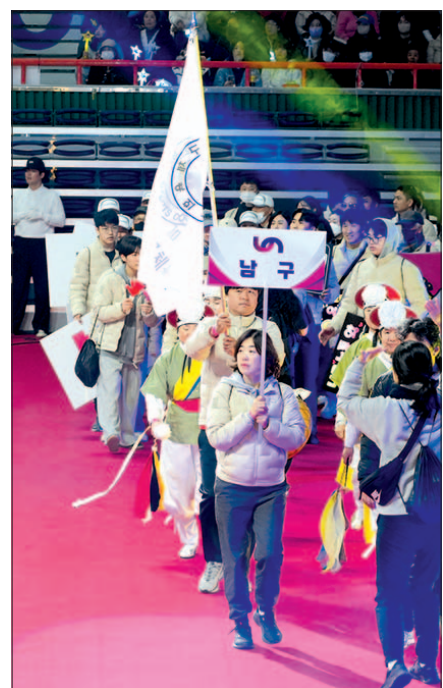
제36회 부산시민체육대축전 개최에 남구 생활체육 동호인들이 입장하고 있다.