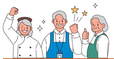
노인일자리 사업 5면 게재